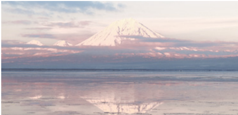
Авачинская бухта, полуостров Камчатка