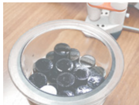
Аншлиф-брикеты — отполированные заготовки из проб измельченного угля

Изучение твердых горючих ископаемых начинается с определения их генетических параметров — петрографии. Это отрасль геологии, которая изучает свойства горных пород, их минералогический и химический составы, структуру и текстуру, условия залегания, закономерности распространения, происхождения и изменения в земной коре и на поверхности Земли. Основным параметром, определяющим степень метаморфизма углей, — отражательная способность витринита (наиболее распространенного и поэтому важнейшего органического микрокомпонента, различимого только под микроскопом по характерным петрографическим признакам). Отражательная способность витринита углей определя-