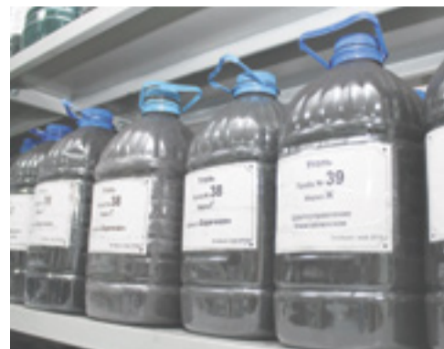
Банк углей насчитывает более 130 образцов пластовых пород