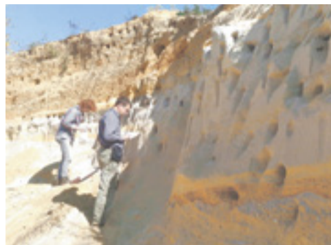
На разрезе палеоманзурских отложений