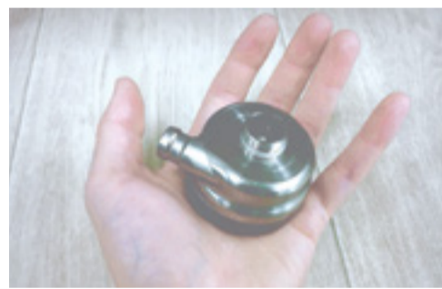
Дисковое искусственное сердце

Следующим этапом стали «острые» эксперименты на мини-пигах, представленных ФИЦ «Институт цитологии и генетики СО РАН». «Мы хотели посмотреть технологию постановки именно этого вида насоса у животных. Эксперимент длился шесть часов. Это достаточно произвольное время, у нас не было цели максимально продлить срок работы насоса в живом организме (для этого будет проведен «хронический» эксперимент, к которому нужно организовать специаль-