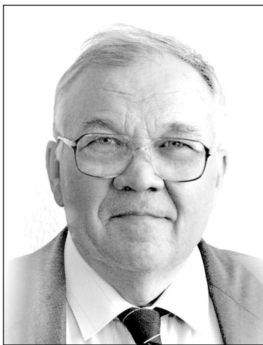
Академик Н.Л. Добрецов

В комментарии к нашей заметке «Где притворство, а где истина» А.Л. Асеев и В.К. Юрченко продолжили дискуссию о судьбе построенной подстанции «Новая Академическая» и сопутствующих вопросах жизнеобеспечения Академгородка. Дискуссия в трёх статьях, опубликованных в газете «Наука в Сибири» (№ 5 от 31.01.2013 г. и № 8 от 21.02.2013 г.) велась с разных позиций, но в любом случае привлекла внимание читателей. Нет большого смысла продолжать эту дискуссию, но для уточнения и симметрии (две на две публикации) ограничусь самыми краткими комментариями.