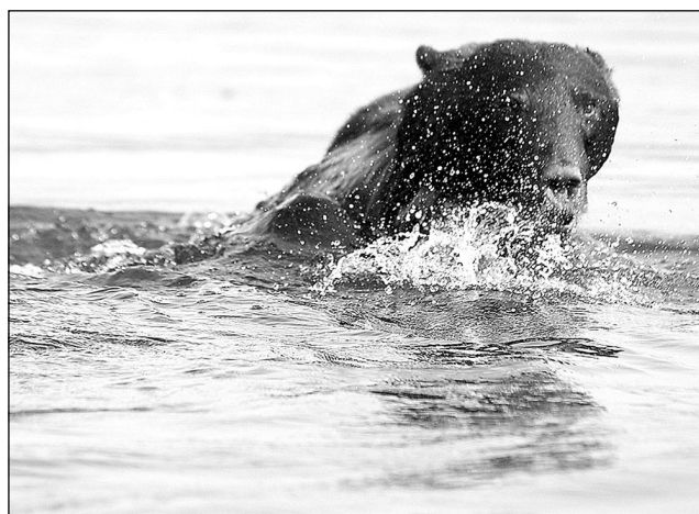
Фото принимаются в нескольких номинациях: «Былинки и травинки», «Зверушки и букашки», «Полянки, долинки и горушки», «Природа сквозь призму фотошопа», «Её величество Флора», «Эти забавные зверушки», «И нет нам покоя ни ночью, ни днем!», «За тридевять земель», «Мы покажем все скрытое!», словом, вся природа, кроме фотографий домашних питомцев. Победителей выявляют путем тайного голосования среди всех желающих.

Победившие (в каждой номинации) награждаются денежными призами или ценными подарками, лучшие фотографии получают в подарок календари и кружки со своими фотографиями. Свои призы учреждает и дирекция института. Замечательное начинание — ведь теперь снимки не пылятся на старых фотоаппаратах и винчестерах компьютеров, а радуют глаз, украшая собой календари и стены института!