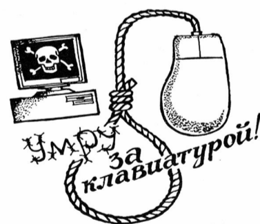
Наносится лично М.С.Досовым студентам, специализирующимся в институте Систем информатики СО РАН на ладонь правой руки.