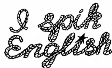
Наколка выпускника английской специализированной школы №130 Академгородка. Наносится в аттестат о среднем образовании.