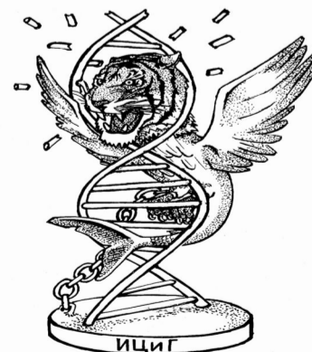
«От благодарного потомства». Наносится генетическим донорам в случае ошибки эксперимента.

Наука в Сибири УЧРЕДИТЕЛЬ — СО РАН Редактор Ю. ПЛОТНИКОВ