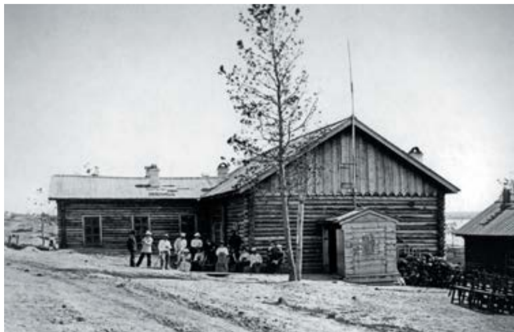
Интеллигенция Новониколаевского поселка у здания школы. Фото 1890-х годов