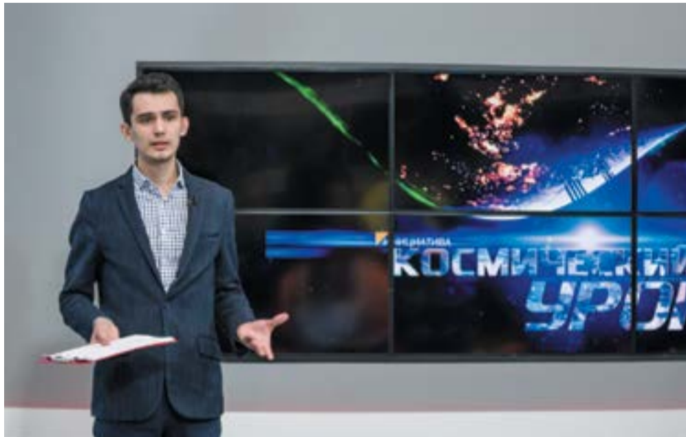
Космический урок «Пилотируемая космонавтика. Земля в иллюминаторе»

Название членов космической экипажа зависит от страны их происхождения и государственной принадлежности корабля. Китайские звездоплыватели называются тайконавтами (части слова перед «-навт» означают «космос»), индийские — виоманавтами, американские и европейские — астронавтами (во Франции также употребляется термин спаснот — spationaute, а в германоязычных странах раумфарер — Raumfahrer), японские — утюхикоси, малайзийские — ангасаванами, южнокорейские — уджуинами. В Казахстане кроме русского космонавт покорителей орбиты называют гарышкерами.