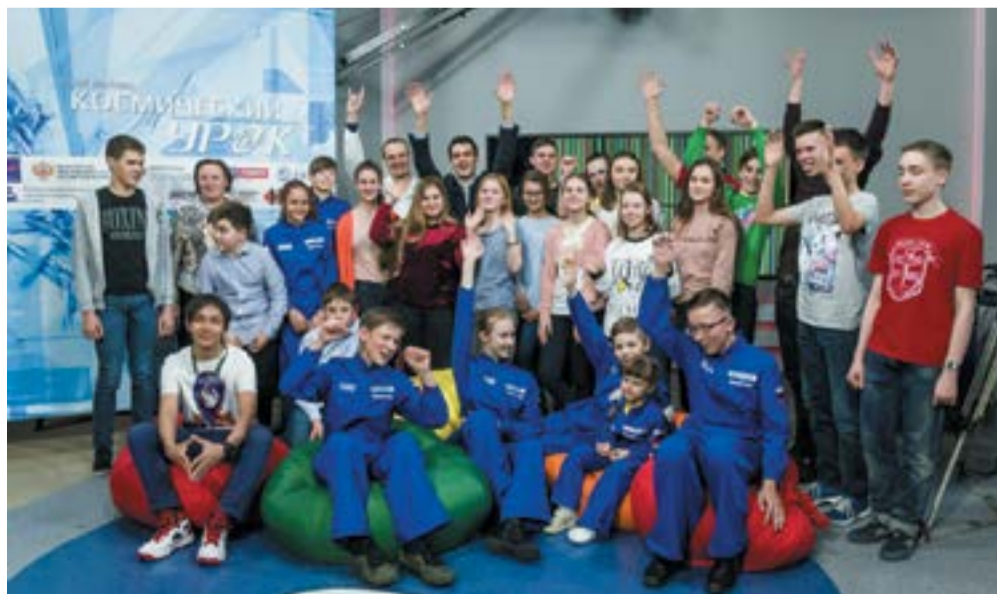
Участниками седьмого космического урока стали российские школьники из Томска, Королева и Сочи