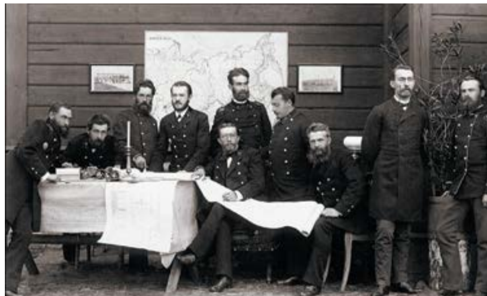
Инженеры-строители моста через Обь

Рабочий. Конечно же, в первую очередь. Рабочие составляли три четверти жителей поселка. Условия их жизни и труда были, прямо скажем, не очень. «Довольно убогие строения лепились по склонам оврагов на берегу Каменки и