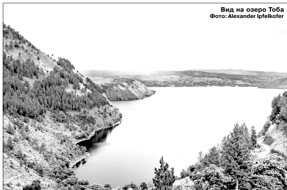
Вид на озеро Тоба

Екатерина Пустолякова